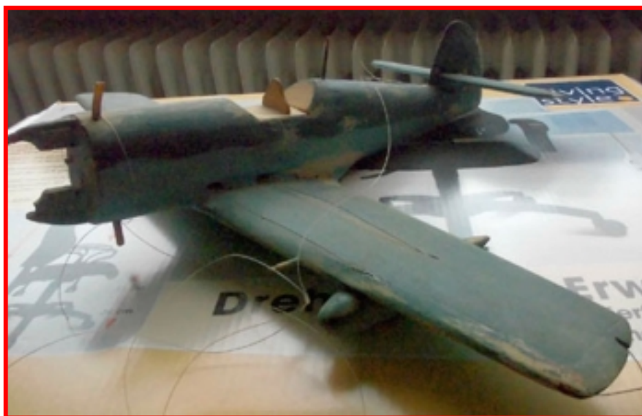
Graupner Me 109 – Ruine, gesehen bei Ebay